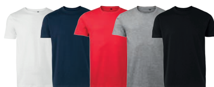
01 white 28 navy 65 red 94 medium grey melange 99 black

MATERIAALI 100% puuvillaa. PAINO 140 g/m 2 PESUOHJE 60° KOOT 120–140–160.