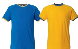
24 lt.royal/yellow 45 yellow/lt.royal

MATERIAALI 100% puuvillaa. PAINO 155 g/m 2 PESUOHJE 60° KOOT 80–100–120–140–160.