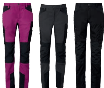
38 dark cerice