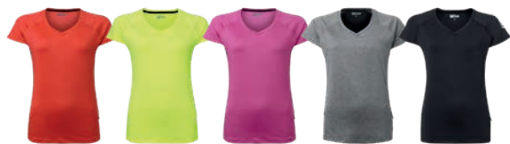
43 spicy orange