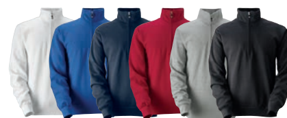
01 white 25 royal 28 navy 65 red 93 grey 99 black melange

MATERIAALI 80% puuvillaa, 20% polyesteriä. Väri 93 on 75% puuvillaa, 20% polyesteriä, 5% viskoosia. PAINO 315 g/m 2 PESUOHJE 60° KOOT 120–140–160.