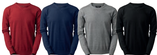
67 red melange