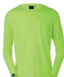
46 fluorescent yellow