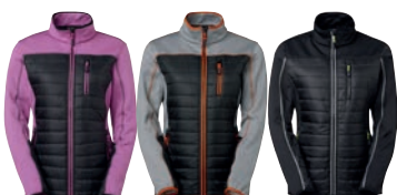
70 fuchsia melange

MATERIAALI 92% polyesteriä, 8% elastaania PAINO 240 g/m 2 PESUOHJE 40° KOOT XS–S–M–L–XL–XXL.