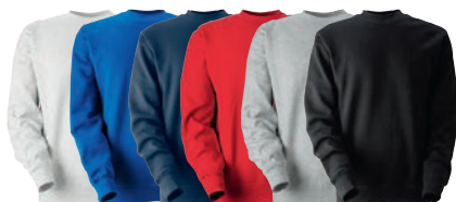
01 white 25 royal 28 navy 65 red 93 grey 99 black melange

MATERIAALI 80% puuvillaa, 20% polyesteriä. Väri 93 on 75% puuvillaa, 20% polyesteriä, 5% viskoosia. PAINO 315 g/m 2 PESUOHJE 60° KOOT 120–140–160.