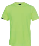
46 fluorescent yellow