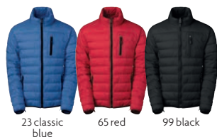
23 classic blue

MATERIAALI 100% nailonia. Väri 98 on 67% nailonia, 33% polyesteriä PAINO 250 g/m 2 PESUOHJE 40° KOOT 120–140–160.