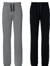
94 medium grey melange