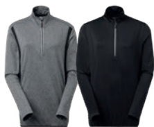
94 medium grey melange

MATERIAALI Väri 94 on 92% polyesteriä, 8% elastaania. Väri 99 är 90% polyesteriä, 10% elastaania. PAINO 200 g/m 2 PESUOHJE 40° KOOT XS-S-M-L-XL-XXL.