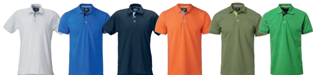
01 white/grey 14 cobalt/navy 28 navy/white 47 dark orange/grey 50 light olive/lime 56 bright green/navy

KOOT XS-S-M-L-XL-XXL-3XL. 4XL ainoastaan väreissä 28, 65 ja 99.