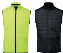
46 fluorescent yellow