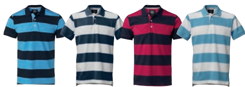
27 blue/ navy