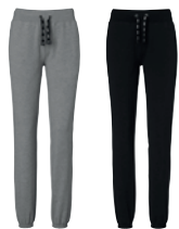
94 medium grey melange