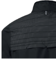
Heijastavat somisteet olkapäissä