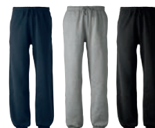
28 navy 93 grey 99 black melange

MATERIAALI 80% puuvillaa, 20% polyesteriä. Väri 93 on 75% puuvillaa, 20% polyesteriä, 5% viskoosia. PAINO 315 g/m 2 PESUOHJE 60° KOOT 120–140–160.