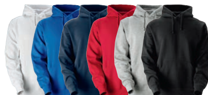
01 white 25 royal 28 navy 65 red 93 grey 99 black melange

MATERIAALI 80% puuvillaa, 20% polyesteriä. Väri 93 on 75% puuvillaa, 20% polyesteriä, 5% viskoosia. PAINO 315 g/m 2 PESUOHJE 60° KOOT 120–140–160.