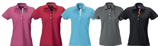
62 cerise/grey 65 red/black 81 aqua/white 97 graphite/grey 99 black/red