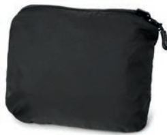
Viikkaa takki pieneksi pussiksi.