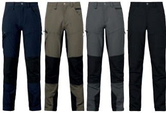
28 navy 57 olive 97 graphite 99 black

MATERIAALI 92 % nylon, 8 % spandexia PAINO 200 g/m 2 PESUOHJE 40° KOOT C44, C46, C48, C50, C52, C54, C56.