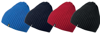
14 cobalt blue 28 navy 65 red 99 black