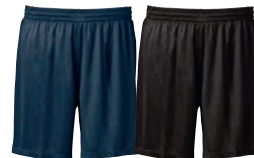
28 navy 99 black

MATERIAALI 100% polyesteriä PAINO 150 g/m 2 PESUOHJE 40° KOOT 120–140–160.