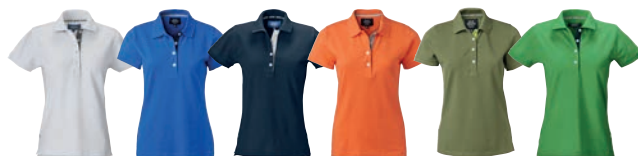
01 white/grey 14 cobalt/navy 28 navy/white 47 dark orange/grey 50 light olive/lime 56 bright green/navy