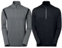
94 medium grey melange

MATERIAALI Väri 94 on 92% polyesteriä, 8% elastaania. Väri 99 är 90% polyesteriä, 10% elastaania. PAINO 200 g/m 2 PESUOHJE 40° KOOT S-M-L-XL-XXL-3XL.