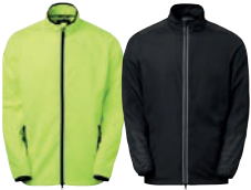
46 fluorescent yellow

MATERIAALI 100% polyesteriä PESUOHJE 40° KOOT S-M-L-XL-XXL-3XL.