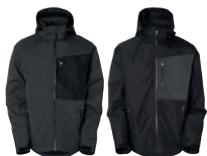
98 dark grey

MATERIAALI 100% poylesteriä HENGITTÄVYYS 3.000g/m 2 /24h VESIPILARI 3.000mm PAINO 280 g/m 2 PESUOHJE 60° KOOT S-M-L-XL-XXL-3XL-4XL.