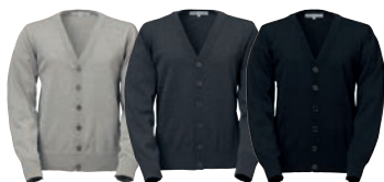
93 grey melange

MATERIAALI 100% puuvillaa. PESUOHJE 40° KOOT S-M-L-XL-XXL.