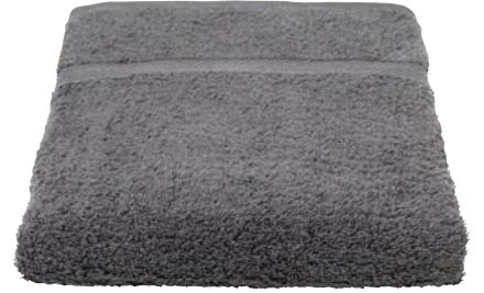
98 dark grey