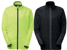
46 fluorescent yellow

MATERIAALI 100% polyesteriä PESUOHJE 40° KOOT XS-S-M-L-XL-XXL-3XL.