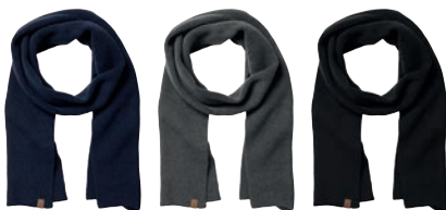
28 navy 93 greymelange 99 black