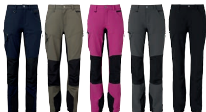
28 navy 57 olive 62 cerice 97 graphite 99 black

MATERIAALI 92 % nylon, 8 % spandexia PAINO 200 g/m 2 PESUOHJE 40° KOOT 34, 36, 38, 40, 42, 44, 46.