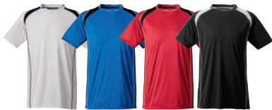
01 white/ navy 25 royal/ black 65 red/ black 99 black/ white

MATERIAALI 100% polyesteriä PAINO 150 g/m 2 PESUOHJE 40° KOOT 120–140–160.