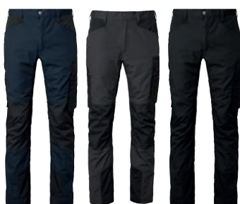
80 dark navy