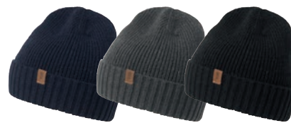
28 navy 93 greymelange 99 black