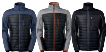
88 blue melange

MATERIAALI 92% polyesteriä, 8% elastaania PAINO 240 g/m 2 PESUOHJE 40° KOOT S–M–L–XL–XXL–3XL.