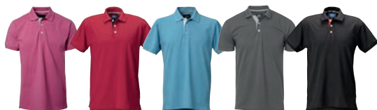
62 cerise/grey 65 red/black 81 aqua/white 97 graphite/grey 99 black/red