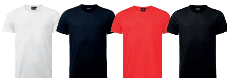
01 white 28 dark navy 65 red 99 black

MATERIAALI 100% polyesteriä PAINO 140 g/m 2 PESUOHJE 40° KOOT 120–140–160.